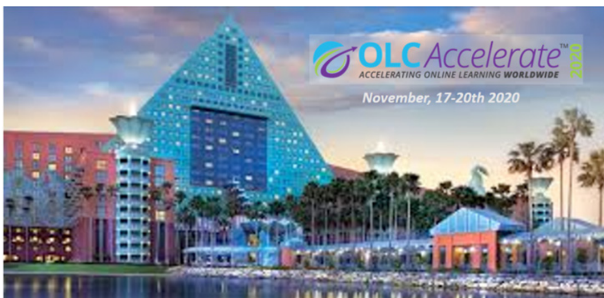
Annonce du prochain rendez-vous OLC Accelerate 2020

caractère exploratoire autour de discussions et d'échanges continues sur le potentiel des nouvelles technologies dans l'enseignement, ainsi que du processus de leur mise en œuvre. Il est dès à présent prévu une autre conférence avec une approche sensiblement différente, « l'OLC Accelerate 2020 » qui mettra l'accent sur la recherche et le réseautage dans un espace d'apprentissage pervasif. Elle devrait se tenir à Orlando du 17 au 20 novembre 2020.